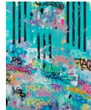
SELFIE, de Xare